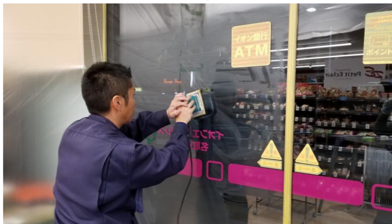
清掃作業(コンパウンドにて汚れ、油脂除去)