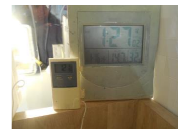
＜フミンコーティング施工ガラス＞