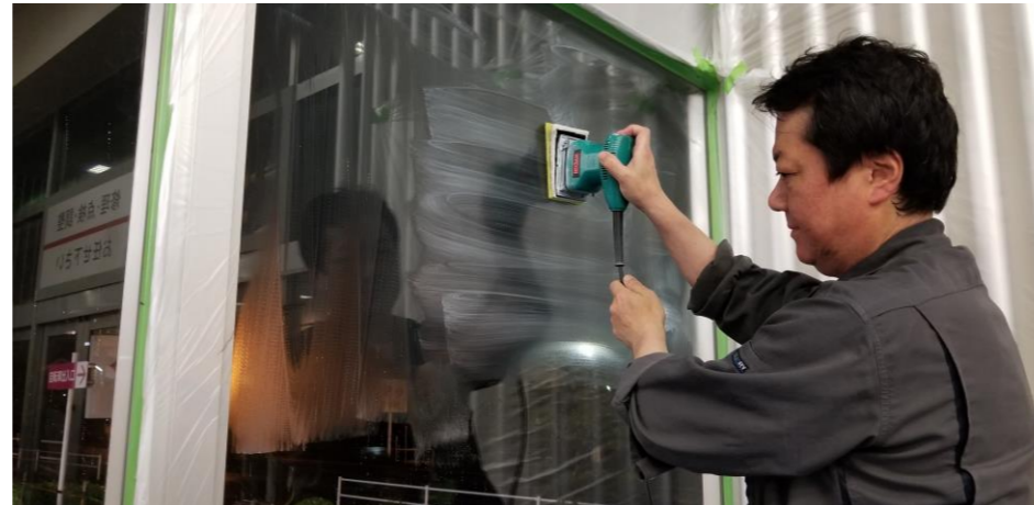
清掃作業(コンパウンドにて汚れ、油脂除去)