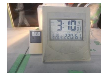
<フミンコーティング施工ガラス>