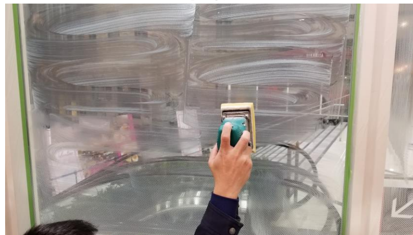
清掃作業(コンパウンドにて汚れ、油脂除去)