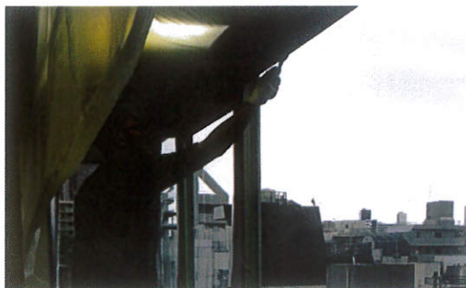
金属へら(スクレーパー)にて汚れ落とし作業