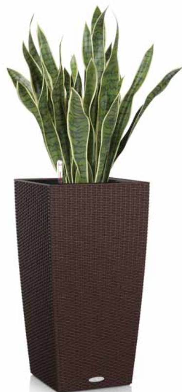
サンセベリア植栽込み