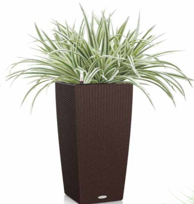
オリヅルラン植栽込み

時期により植込む植物のイメージが変わります。 沖縄・離島は別途運賃料金がかかります。