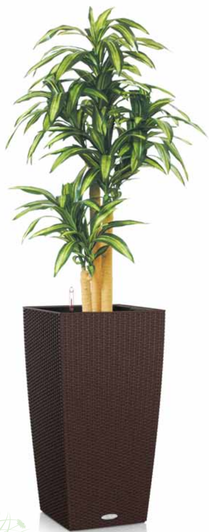
ドラセナ植栽込み