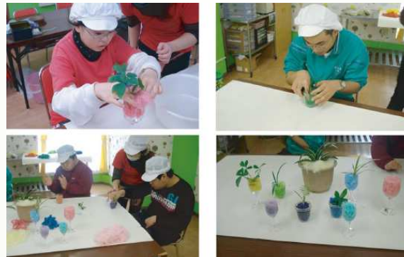
施設にての植物植え込み作業写真