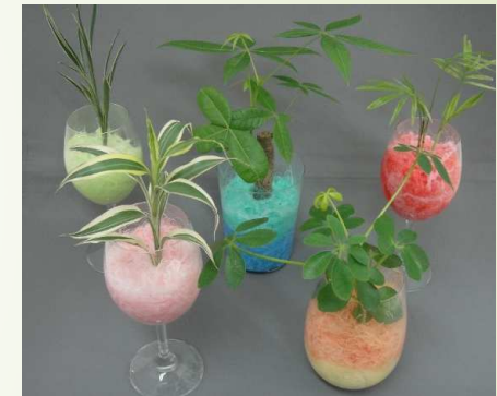
完成品 受付、洗面所、オフィスに